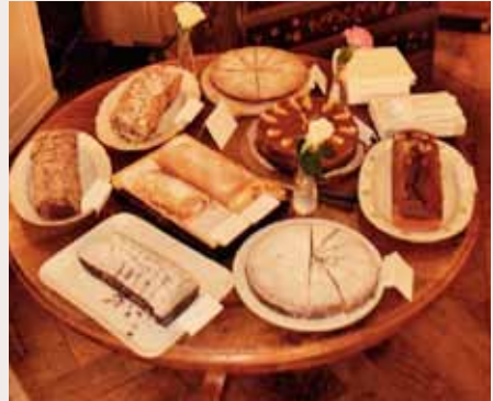
Spiel – Spannung – Spass und delta Kuchen!

Im November konnten wir unser zweites Jassturnier in der Heiteren Fahne ( www.dieheitererfahne.ch ) durchführen. Auch dieses Jahr hat uns die Heitere Fahne grosszügig unterstützt und uns ihren Saal gratis zur Verfügung gestellt. Daneben haben uns zahlreiche Unternehmen von Bern geniale Preise spendiert: Anthem & Arrows, OLMO, UTIL, FIZZEN Fashion&Accessories, VIU EYEWEAR, Le Vin du Capitaine, NANA, Barts und Iljos Cucina.