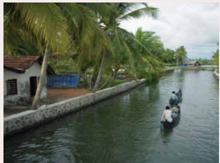
„Backwaters“ von Kuttanad bei normalem Wasserstand