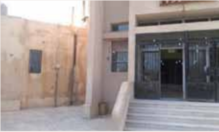
Das neue Gesundheitszentrum von Kobanê