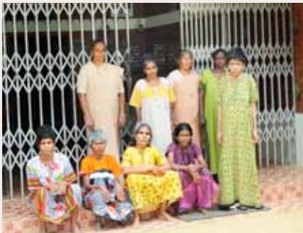
Bewohnerinnen des Wohnheims „Snehatheeram“

Etage entschieden. So sollen einerseits ein grosser Schlafsaal zur temporären Beherbergung der Heimbewohnerinnen während der Monsunzeit und andererseits vier Zimmer für die Angestellten, die sich im Moment zwei Patientenzimmer teilen, entstehen. Im Sinne der Hilfe zur Selbsthilfe hat sich delta entschieden, die Kosten für die Ausbaurbeiten eines zweiten Stockes vollständig zu übernehmen.