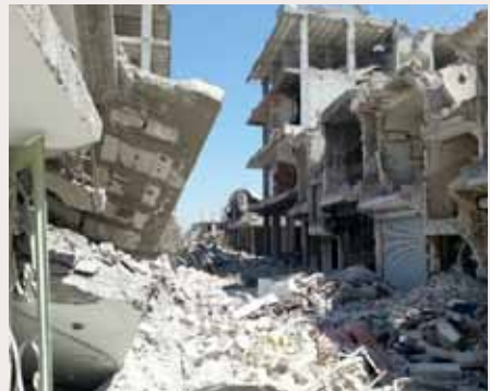
Ein Grossteil von Kobanê liegt in Trümmern

schätzungsweise 50'000 Zivilisten behandelte. Mit den bewaffneten Auseinandersetzungen wurden zwei dieser Krankenhäuser vollständig zerstört und die Infrastruktur der verbliebenen zwei Krankenhäuser wurde zwischen 20 - 50% zerstört. Eine Reihe von Privatkliniken und Pharmazien wurden ebenfalls beschädigt. Zur Grundversorgung der Bürger kommen ausserdem unzählige Kriegsverletzte dazu. Dabei fehlt es neben dem Personal noch an medizinischem Material und der Infrastruktur. Ein ehemaliges gut erhaltenes Regierungsgebäude wurde in ein Gesundheitszentrum umgebaut, das im November 2015 schliesslich eröffnet wurde.