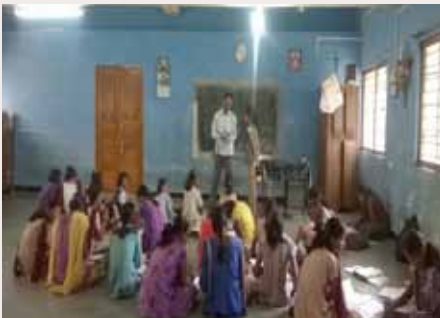
Die Mädchen beim extracurricularen Stützunterricht

Da die Mädchen vorher teilweise keinen oder einen nur ungenügend geleiteten staatlichen Schulunterricht genossen haben, ist das Bildungsniveau