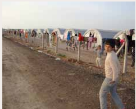
Das Lager Arin Mirxan wo die Grundversorgung stattfindet

ins Spital zugewiesen oder Therapien oftmals nach klinischem Gutdünken und nicht wirklich diagnostisch geleitet werden. Das hat einerseits zur Konsequenz, dass die Akuterkranken zwar gut triagiert werden, die chronisch Kranken jedoch eindeutig unterversorgt sind. Was uns Psychiaterinnen natürlich zusätzlich betroffen hat, war die komplett fehlende Versorgung von Patienten und Patientinnen mit psychiatrischen oder neurologischen Krankheitsbildern.“