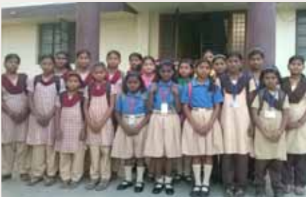
Mädchen des Sarvodaya Girls Hostel mit ihren neuen Schuluniformen

entgegenwirken zu können. Zusätzlich wurden 10 Mädchen aus ärmlichen Verhältnissen das Schulgeld und die Wohnkosten im Internat bezahlt.