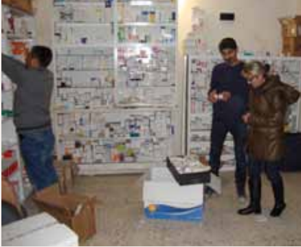
Die Apotheke wo wir unsere mitgebrachten Medikamente abgeben konnten

Mittlerweile sind nach Befreiung der Stadt und dem Grossteiles des Kantons Kobanê die meisten Flüchtlinge wieder zurückgekehrt. Die intensiven Kämpfe um die mittlerweile Symbolcharakter besitzende Stadt Kobanê haben ein Bild der Verwüstung hinterlassen. Um das Ausmaß der Zerstörung bestimmen zu können, wurde Ende Januar 2015 das Kobanê Reconstruction Board (KRB) ins Leben gerufen, dessen Rapport ergab, dass etwa 80% der Stadt mäßig bis schwer zerstört worden sind. Es wurden sowohl die Trinkwasserversorgung, das Abwassersystem und die Stromversorgung praktisch komplett zerstört. Vor den Angriffen des ISIS verfügte Kobanê über vier funktionierende Krankenhäuser, welche über